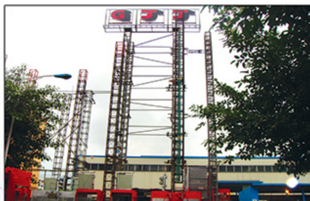
● کنترل نهایی