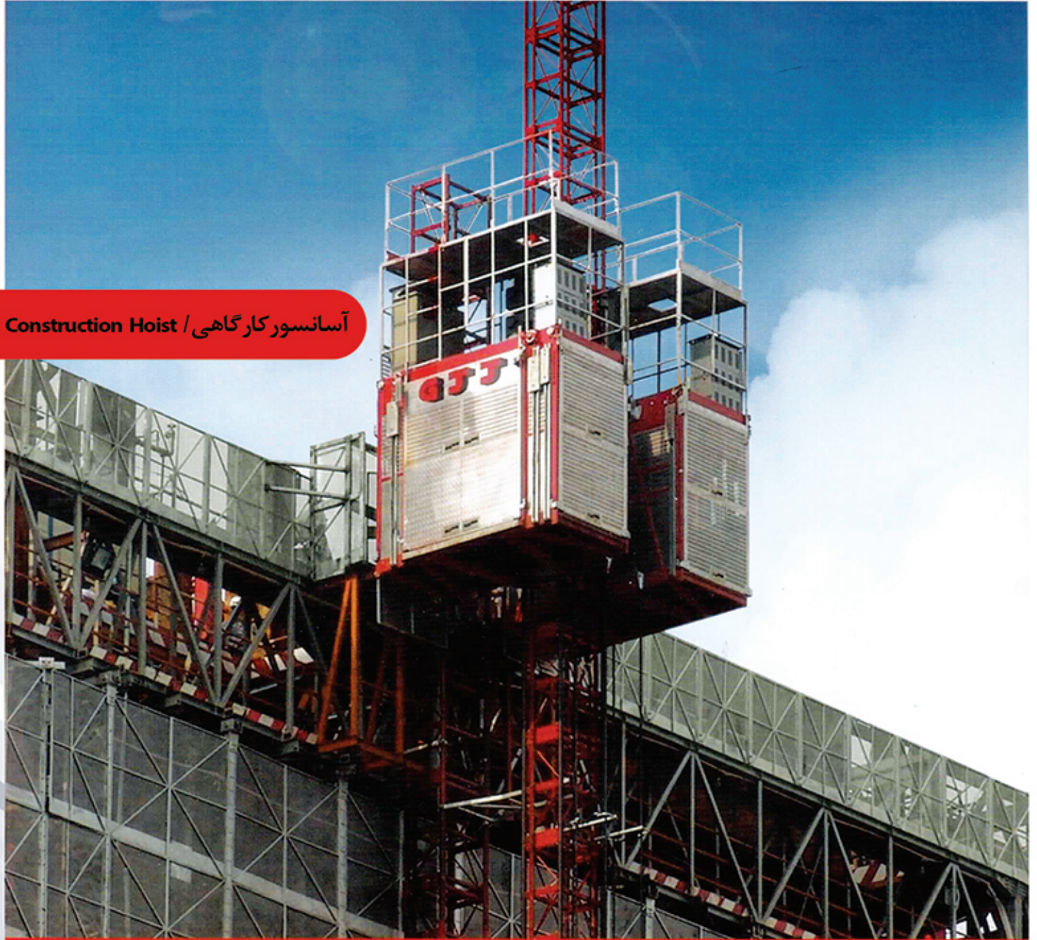
آسانسور کارگاهی / Construction Hoist