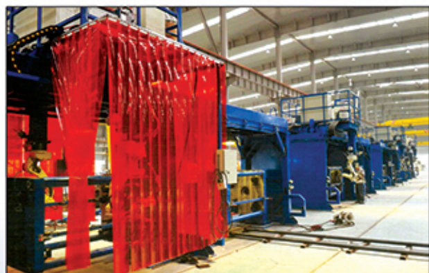
● خط جوش تمام رباتیک