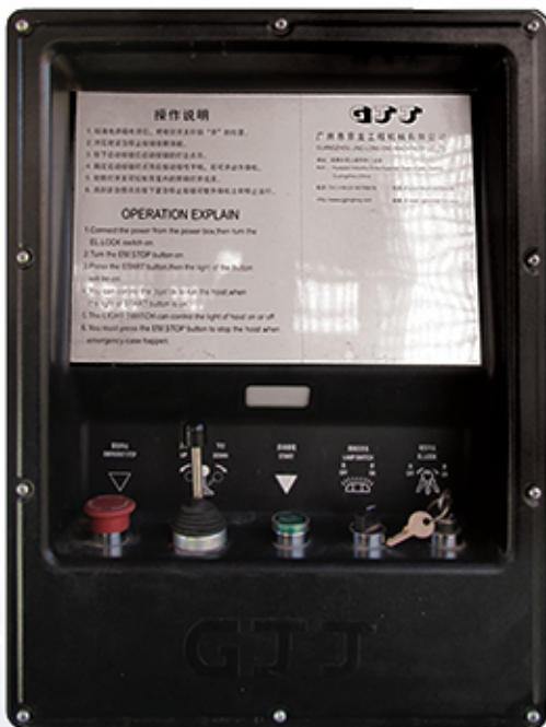
● جعبه فرمان